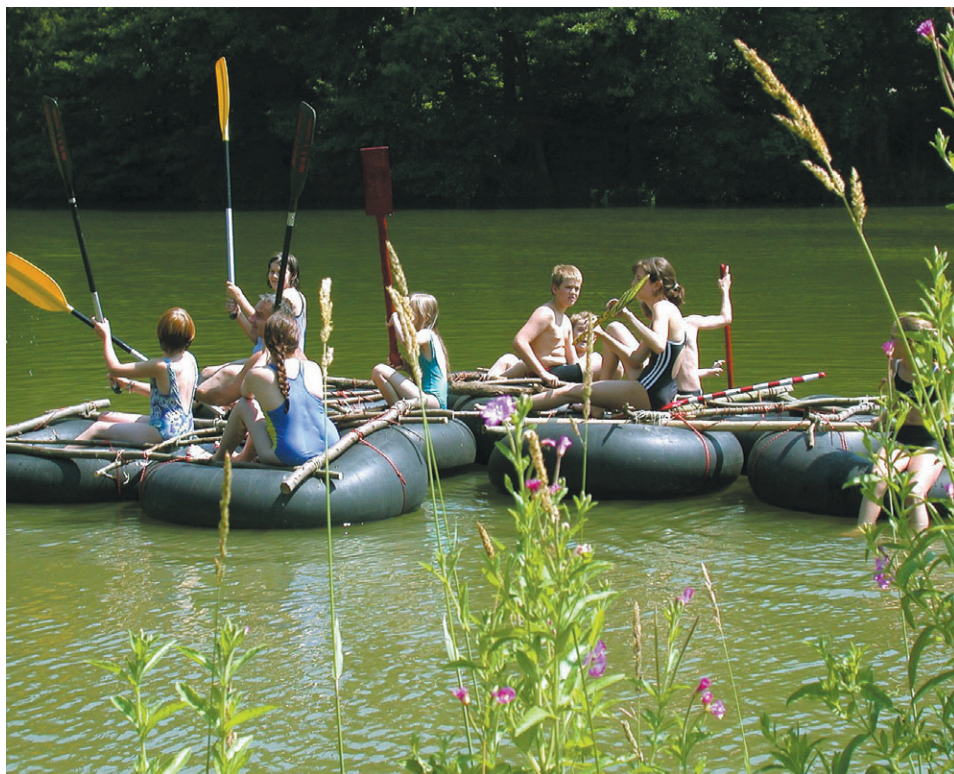
Im Rahmen der jährlich stattfindenden „Sommerferienaktion“ wurde der nahe bei Graz liegende Thalersee durch Aktivitäten des Referats Kind, Jugend, Freizeit ein Ausflugsziel für zahlreiche Grazer Kinder.