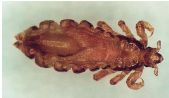
Abb.: Kopflaus, ausgewachsen, weiblich, Sicht auf den Rücken. Im linken Drittel ist durchscheinend ein Ei sichtbar.

Kopfläuse sind seit jeher in Europa heimisch und nach wie vor bei uns sehr weit verbreitet. Das Vorkommen der Läuse überwiegt auf dem behaarten Kopf ist – vorrangig bei Kindern zwischen 3 und 12 Jahren – der häufigste Parasitenbefall in Europa.