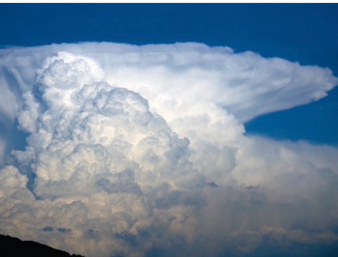
Voll ausgebildete Gewitterwolke