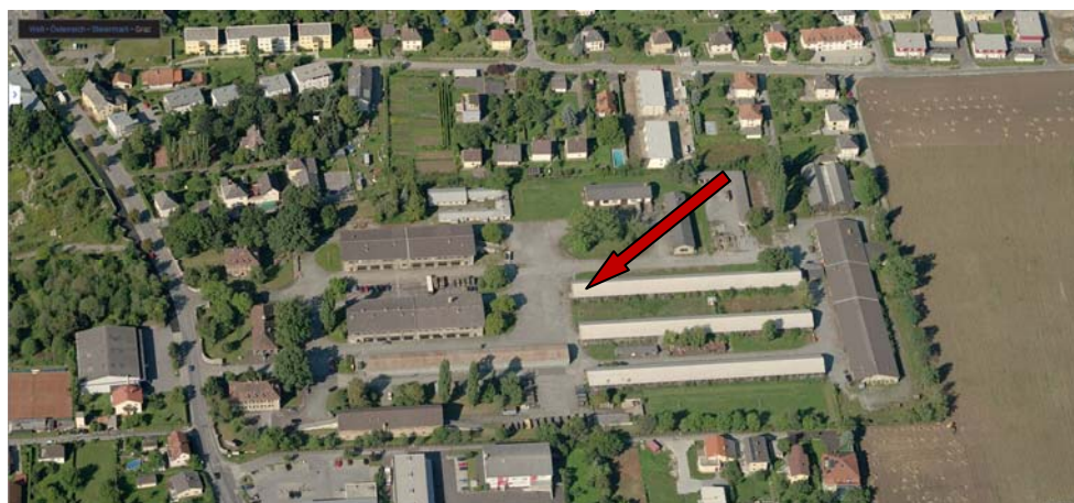
Schrägluftbilder Blick nach Westen. Der Pfeil zeigt auf die Liegenschaft.

Eine verstärkte Wohnentwicklung ist bisher vor allem westlich der GKB-Trasse festzustellen. Durch den Ausbau der GKB zu einer regionalen Schnellbahn, sowie dem geplanten Bau der Südwest-Straßenbahnlinie wird dieser Stadtteil noch besser an das Zentrum wie an die Umlandgemeinden angebunden werden. Das Potential der Reininghausgründe verspricht mittel- bis langfristig einen enormen Bevölkerungszuwachs im unmittelbaren Umfeld.