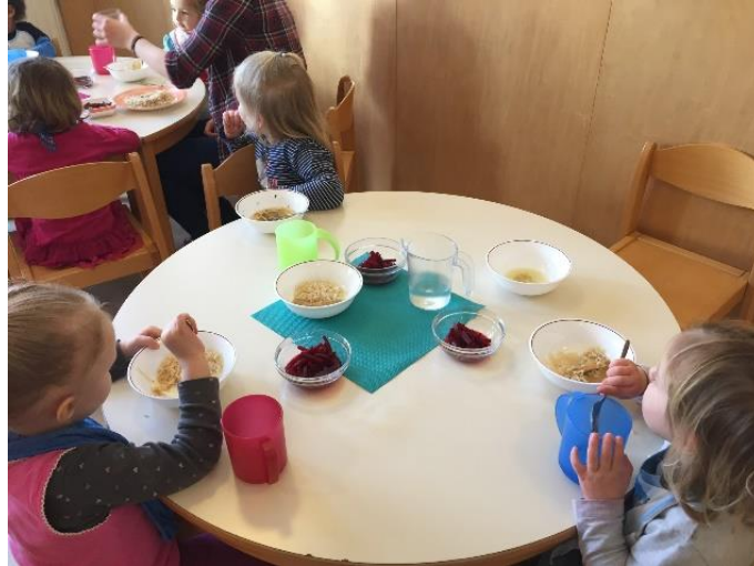
Abb 12: Mittagessen Kinderkrippe

Die Kinderkrippenkinder gehen um ca. 11:00 Uhr zum Mittagessen in den Speiseraum. Diese Zeit wird im Kindergarten besonders genutzt für gezielte pädagogische Angebote und/oder individuelle Förderung.