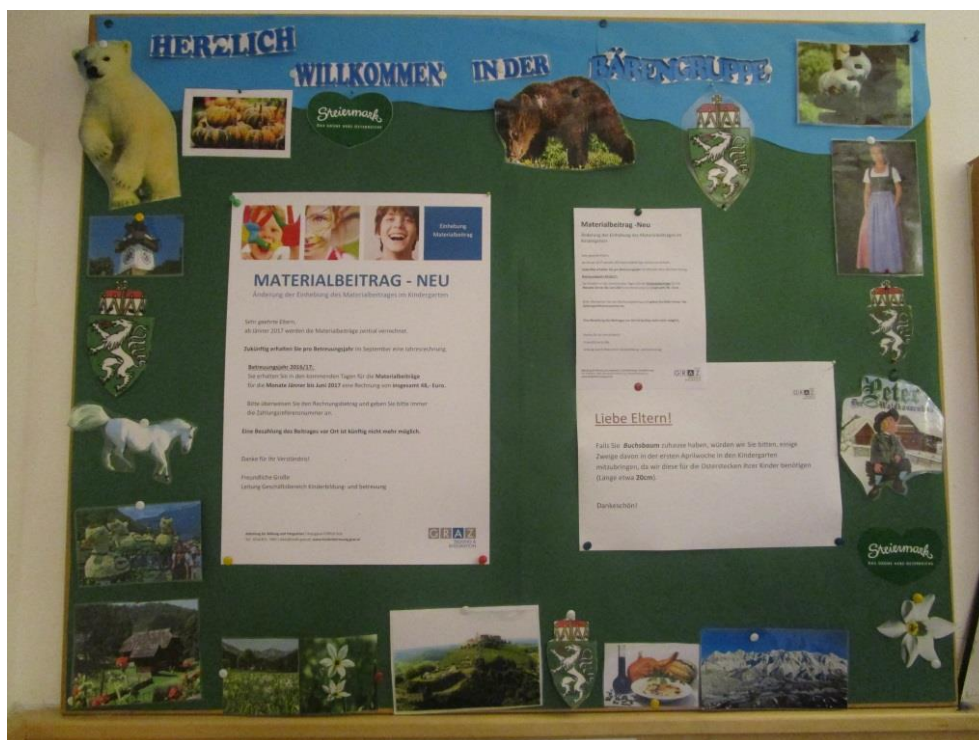
Abb 7: Elterntafel