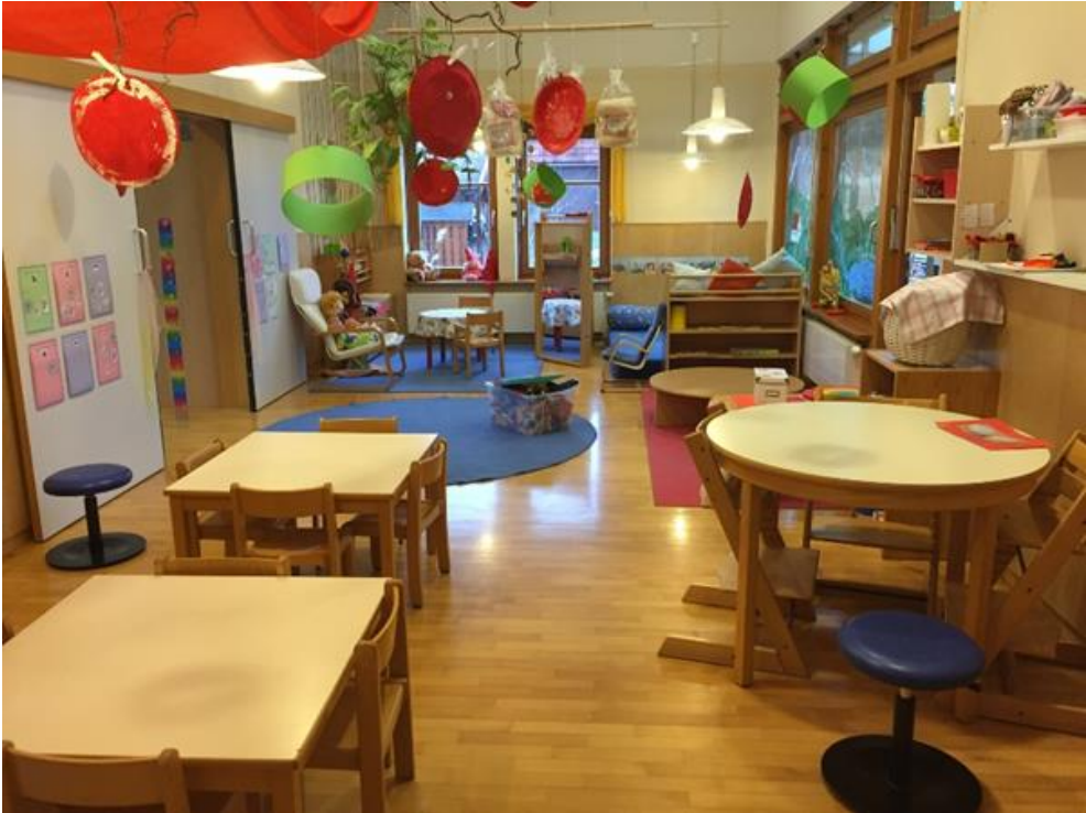
Abb 3. Gruppenraum der Kinderkrippe