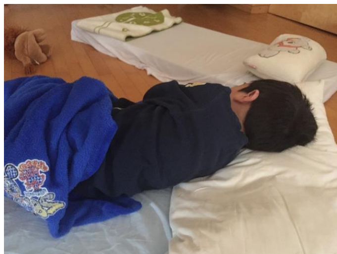
Abb 13: Rasten

Die 3- und 4jährigen Kinder haben die Möglichkeit, im Turnsaal zu rasten und hören dazu beruhigende Musik. Es ist immer eine Kollegin bei den Kindern. Die älteren Kinder rasten in den Stammgruppenräumen. Hier werden entweder Entspannungsgeschichten vorgelesen oder beruhigende Musik gespielt. Ab ca. 13:15 Uhr gibt es eine „Ruhezeit“- das bedeutet, es wird Rücksicht auf die schlafenden Kinder genommen und leise gespielt und gearbeitet (Angebote in der Kleingruppe)