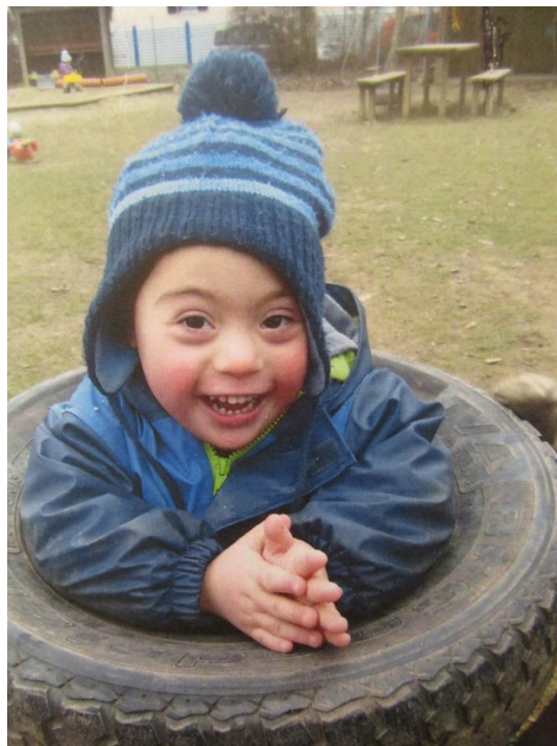
Abb 8: Lachendes Kind im Garten

Bei der offenen Jause entscheiden die Kinder selbst, wann und wie viel sie jausnen und mit wem sie bei Tisch sitzen. Der Tisch wird selbständig gedeckt und die Jause auf den Teller gelegt, sowie das Wasser eingeschenkt. Die Kinder räumen nach der Jause wieder ab und alles weg. Wenn etwas verschüttet wird, können sie selbst den Tisch abwischen oder sich gegenseitig dabei unterstützen.