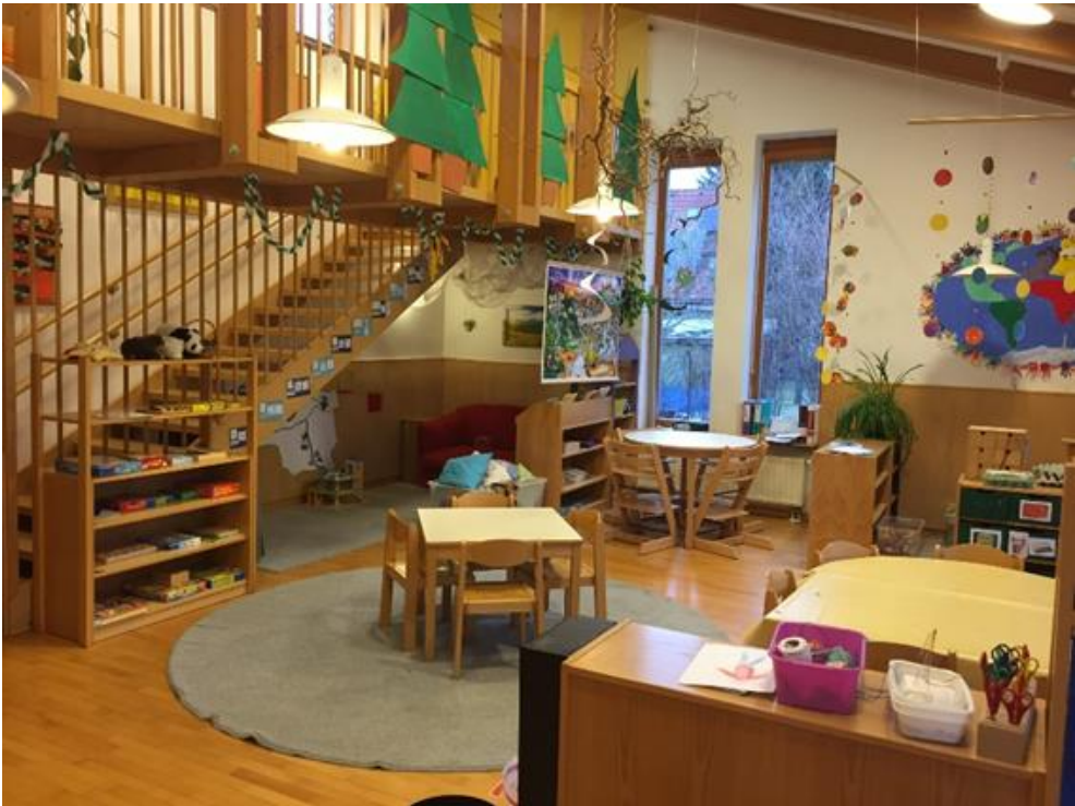
Abb 5: Gruppenraum der Regelgruppe