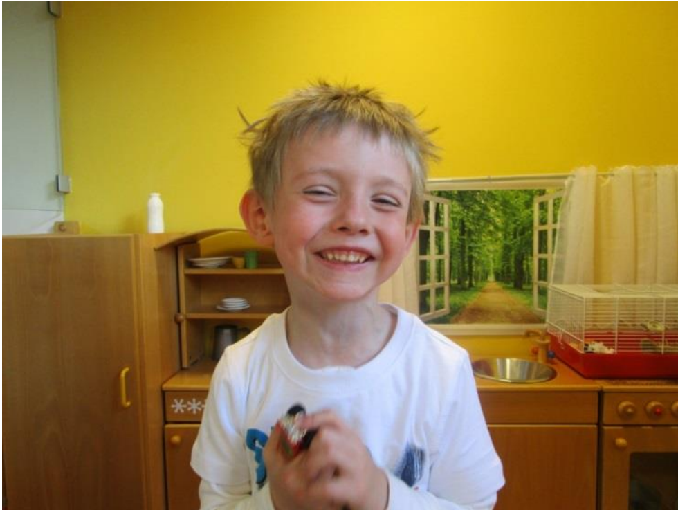
Abb 9: Lachendes Kind