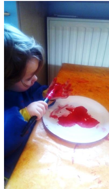
Abb 10: Freispiel

In dieser Zeit essen die Kinder ihre Jause, die sie von zu Hause mitbringen.