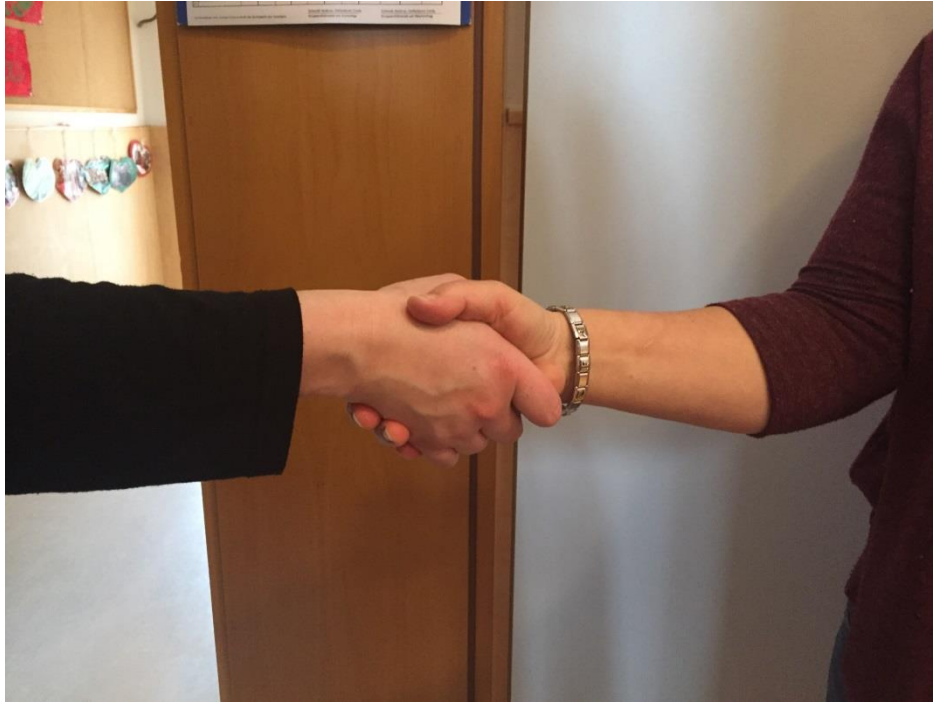
Abb 17: Gespräch zwischen Personal und Eltern