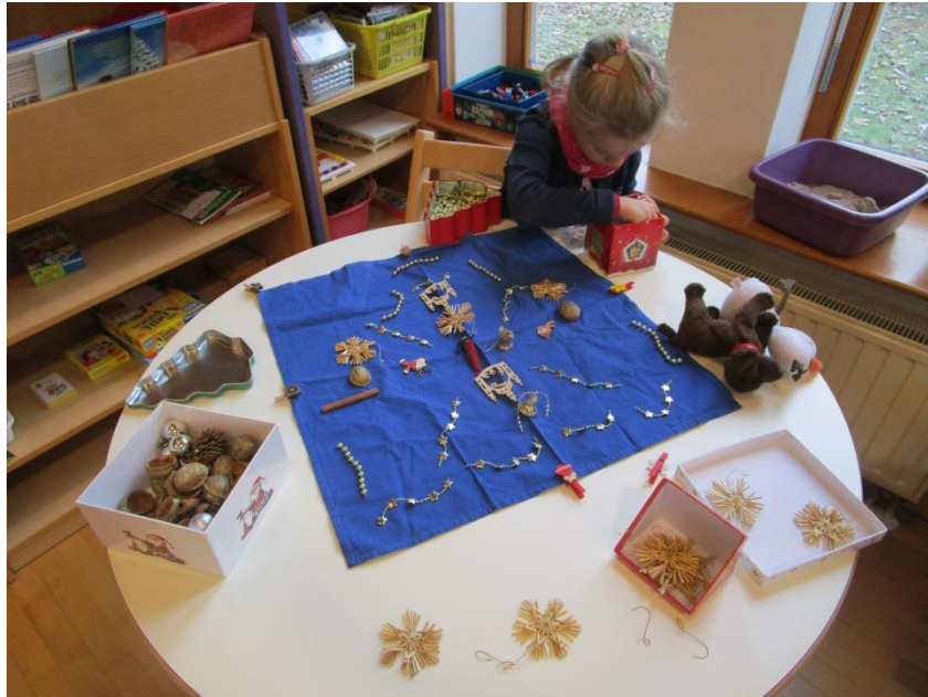
Abb 14: Freispiel

→ In der Kinderkrippe wird um 14.15 gejausnet und im Kindergarten um 15.00 Uhr.