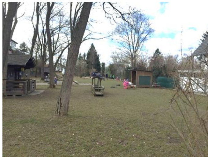
Abb 11: Garten

Wir nutzen jeden Tag unsere Gärten, damit die Kinder ihrem natürlichen Bewegungsdrang nachgehen können.