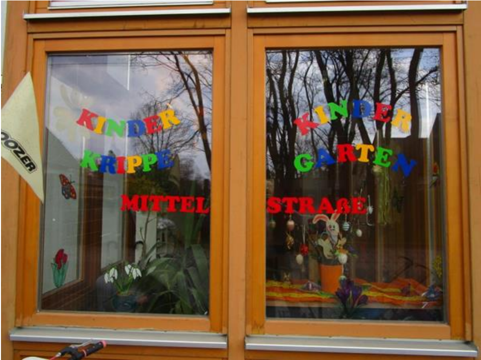
Abb 2: Eingangsbereich