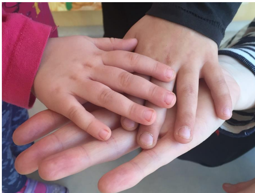
Abb 15: Hände reichen

Wechselseitige Achtung, Anerkennung und Wertschätzung entstehen durch demokratisches Miteinander und selbständiges Handeln.