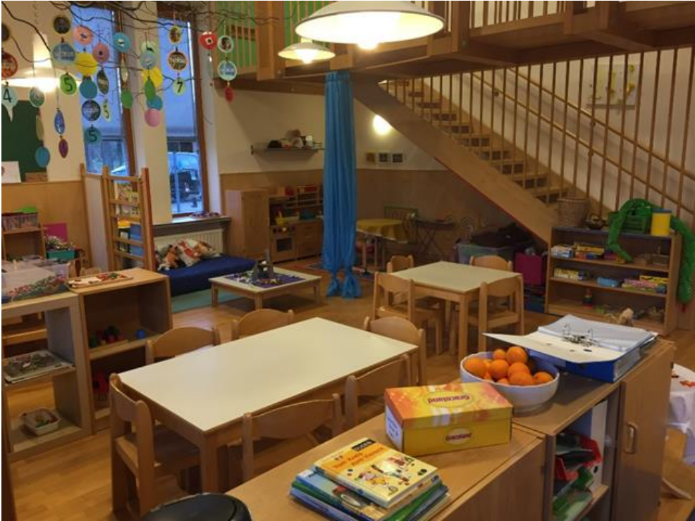
Abb 4: Gruppenraum der Integrationsgruppe