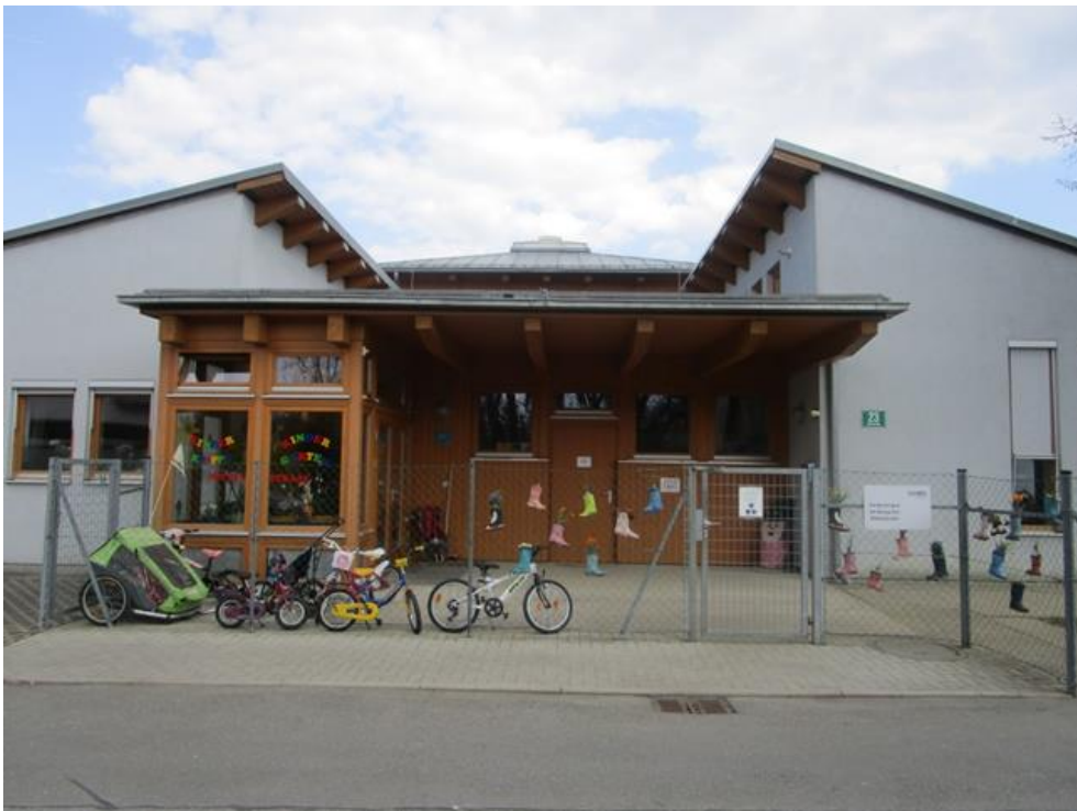
Abb 1: Eingang

Eines unser außernatürlichen Winterangebote ist der Skikurs, welchen wir in Kooperation mit der Skischule Alpfox am Präbichl anbieten. Unser pädagogisch geschultes Personal begleitet die Kinder auf der täglichen Busfahrt, feuert die kleinen Helden/innen an, tröstet oder unterstützt in schwierigen Situationen die bestens ausgebildeten Skilehrer.