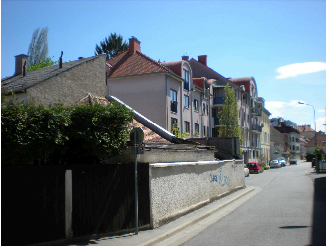
Foto: Straßenzug der Neubaugasse von Norden aus