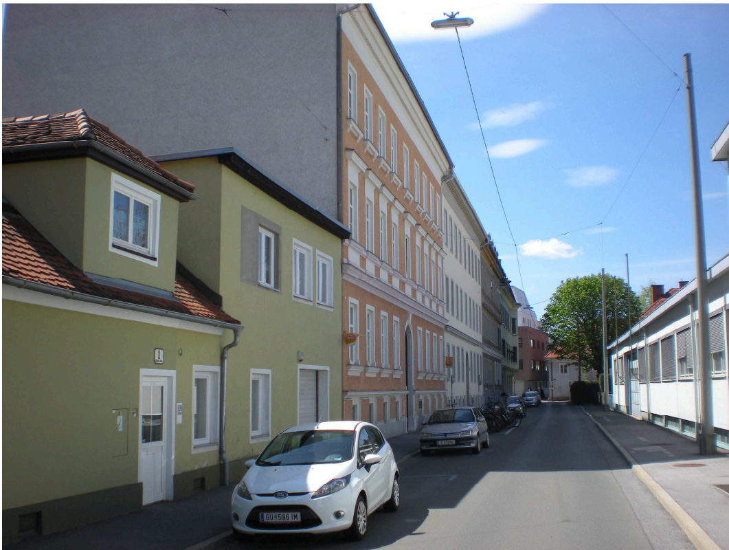
Foto: Straßenzug der Pflanzengasse von Westen aus