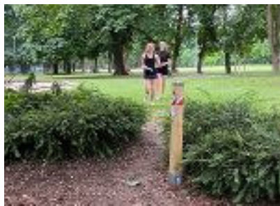
Orienteeing Park

Alle Karten sind auf folgender Webseite erhältlich: https://outdoor-orienteeing.at/o_parks Einfach die Karte in Farbe im Downloadbereich ausdrucken und los geht's.