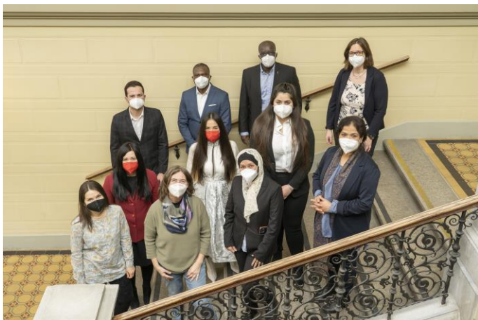
Bürgermeisterin Elke Kahr mit den neuen BeirätInnen & das Personal der Geschäftsstelle

Dieser wurde ja am 26. September 2021 zeitgleich mit dem Gemeinderat neu gewählt. Der MigrantInnenbeirat vertritt mehr als 12 Prozent der Grazer Bevölkerung - also jene 37.000 BürgerInnen, die keine österreichische oder EU-Staatsbürgerschaft, und somit auch kein kommunales Wahlrecht besitzen.