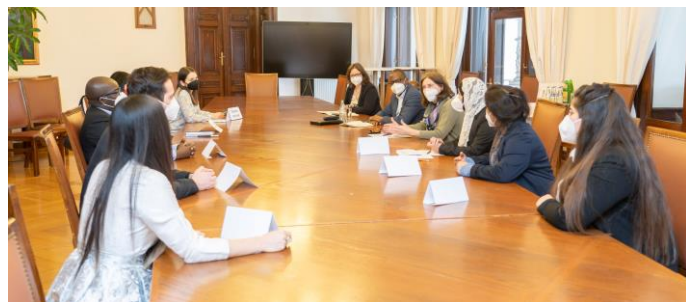
Im Stadtsenatssitzungssaal bei ihrer Konstituierung