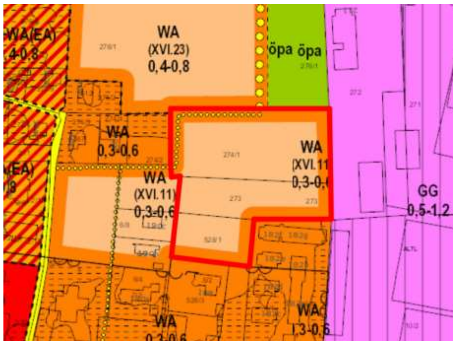
Auszug aus dem 4.0 Flächenwidmungsplan Die rote Umrandung markiert das Planungsgebiet.