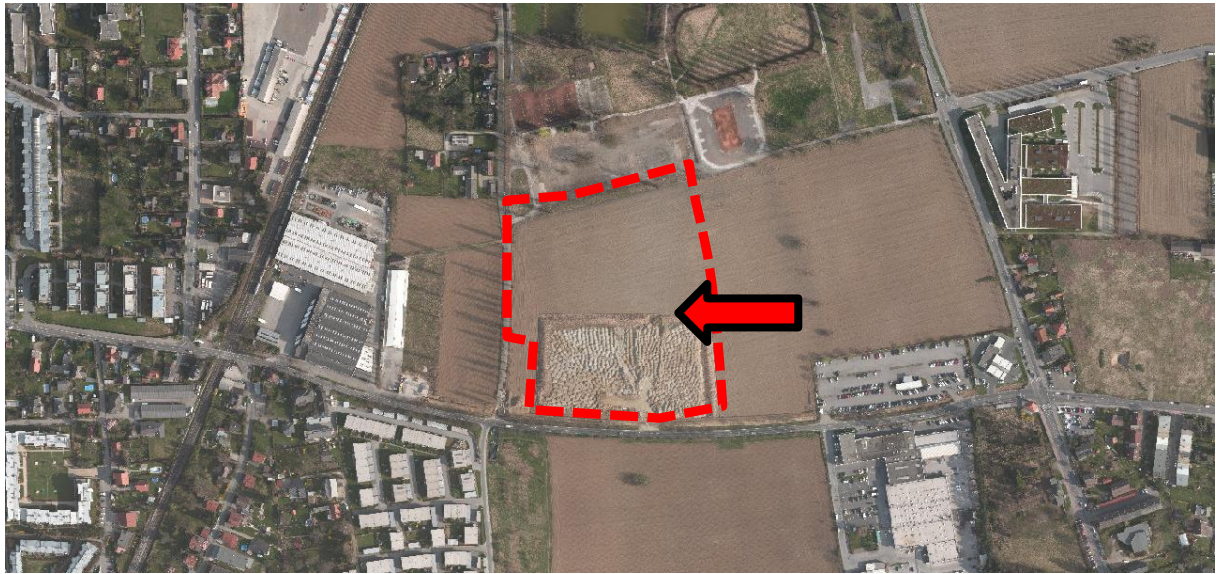
Luftbild (2015): Die rote Umrandung bezeichnet Das Planungsgebiet.