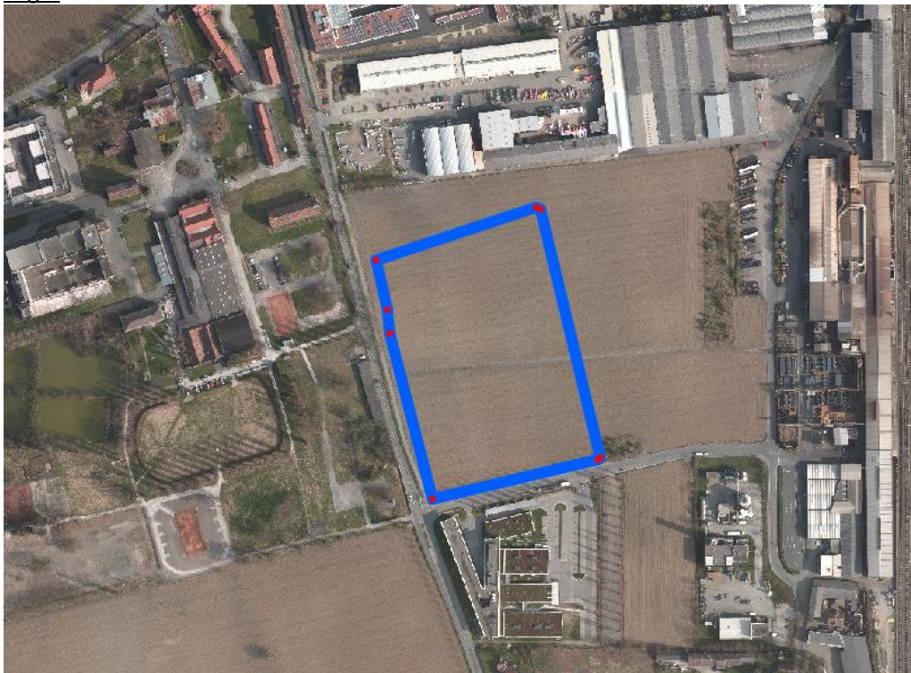
Luftbild (2015): GeoDaten-Graz. Die blaue Umrandung markiert das Planungsgebiet.