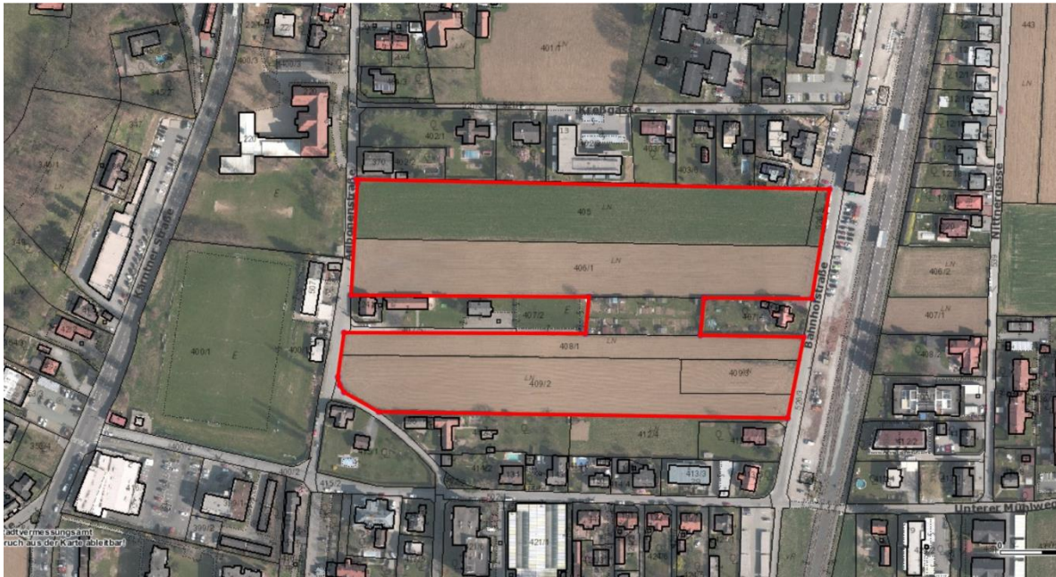
Luftbild (2015): GeoDaten-Graz. Die rote Umrandung markiert das Planungsgebiet.