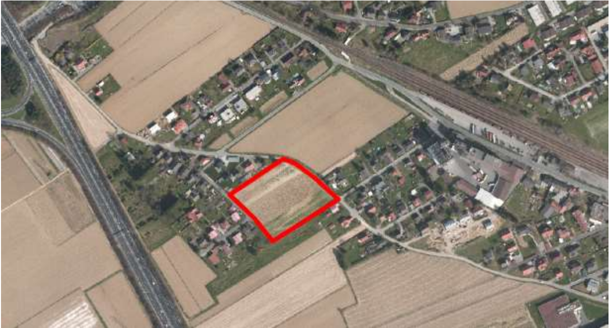
Schrägaufnahme (2015): Blick Richtung Norden. Die rote Umrandung markiert das Planungsgebiet. © Stadt Graz - Stadtvermessung