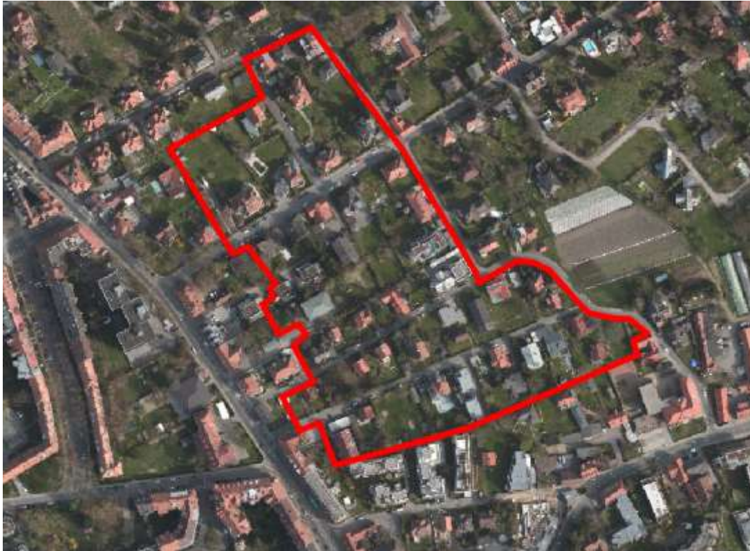
Luftbild (2015): GeoDaten-Graz Die rote Umrandung markiert das Planungsgebiet.