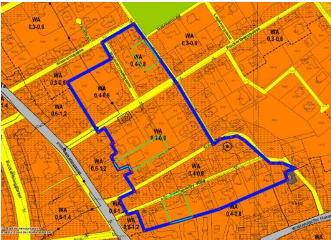
Auszug aus dem 4.0 Flächenwidmungsplan Die blaue Umrandung markiert das Planungsgebiet. Die Eigentümer der grün umrandeten Grundstücke haben die Absicht ihre Liegenschaften zu bebauen.