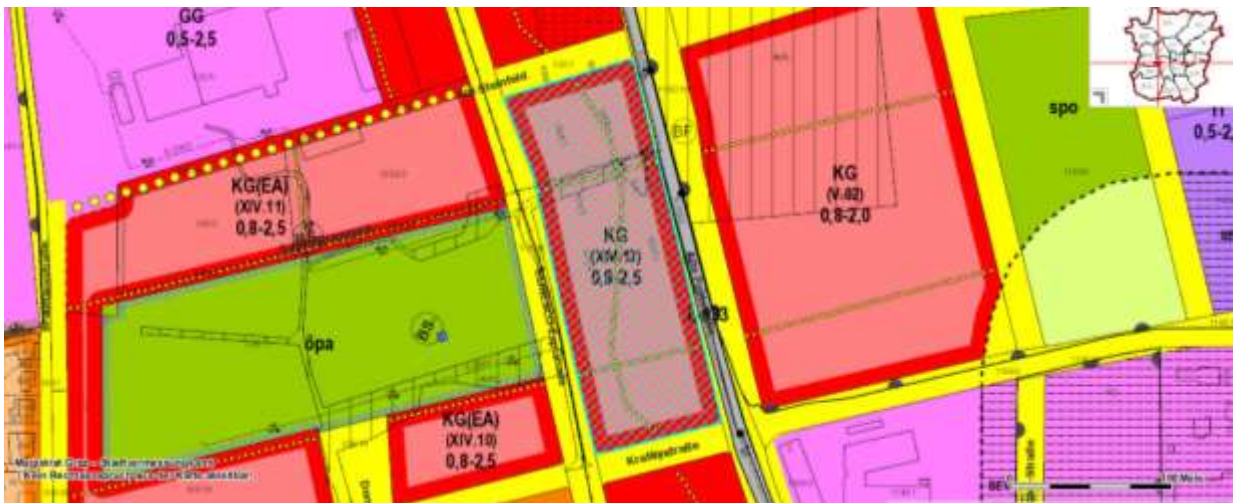
Auszug aus dem 4.0 Flächenwidmungsplan Die karierte Fläche markiert das Planungsgebiet.