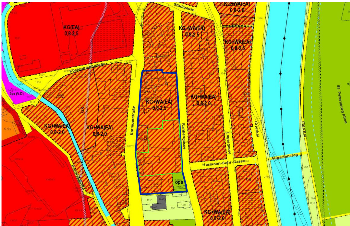
Auszug aus dem 4.0 Flächenwidmungsplan der Landeshauptstadt Graz idgF. Die blaue Umrandung markiert das Bebauungsplangebiet. Die grüne Umrandung bezeichnet die Grundstücke, deren Eigentümer einen Antrag auf Bebauungsplanerstellung gestellt haben.