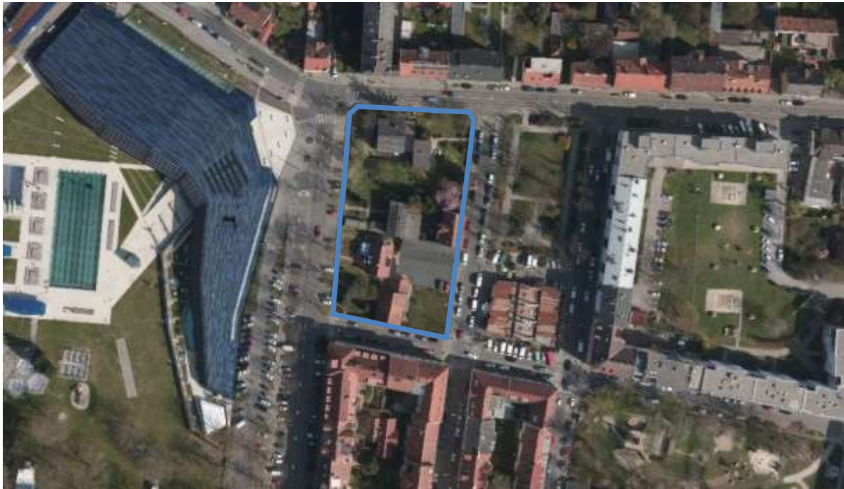
Luftbild: Die blaue Umrandung kennzeichnet das Bebauungsplangebiet.