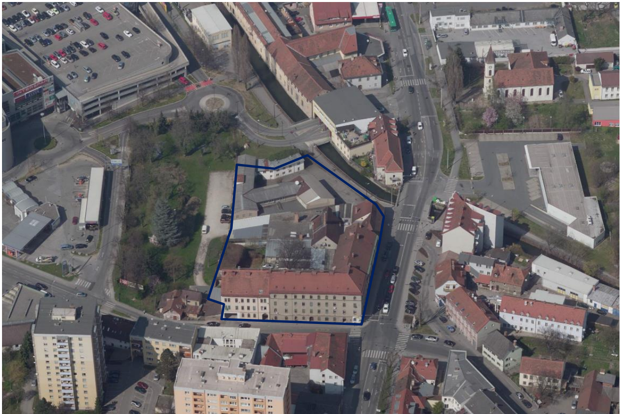
Luftbild (2015 © Stadt Graz – Stadtvermessung): Die blaue Umrandung bezeichnet das Bebauungsplangebiet.