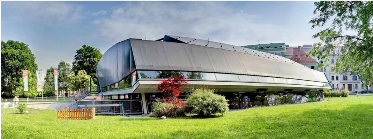
Das Grazer Kindermuseum FRida & freD zeigt 2019/20 die Ausstellungen „Was kost' die Welt?“ und „Mal mal“