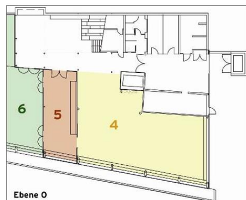
4: Ausstellungsfläche Untergeschoß 5: Labor 6: Garten (Ausschnitt)