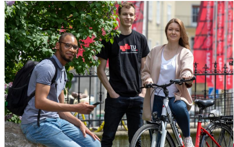
Lunghammer – TU Graz