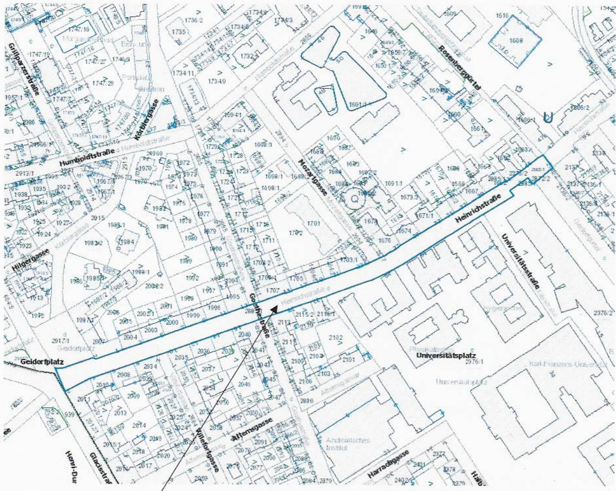
Grundstück Nr. 2885/1, KG Geidorf