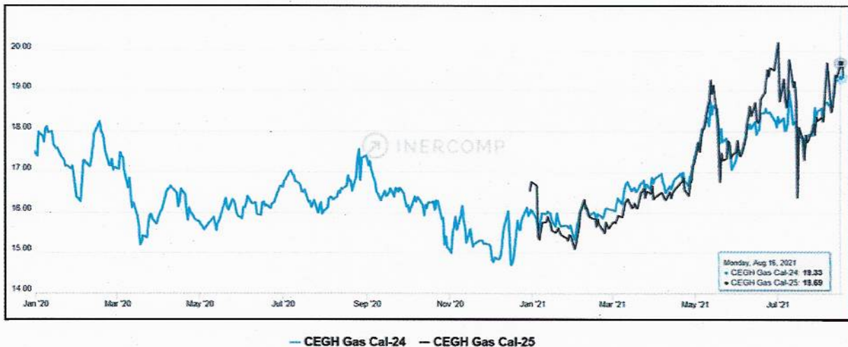
Abb.1.: Grafik der Gasbörsenpreise am CEGH für die handelbaren Lieferjahre 2024 bis 2025 im Handelszeitraum 02.01.2020 bis 16.08.2021; Quelle: GBG-Energieeinkauf auf Datenbasis Inercomp GmbH