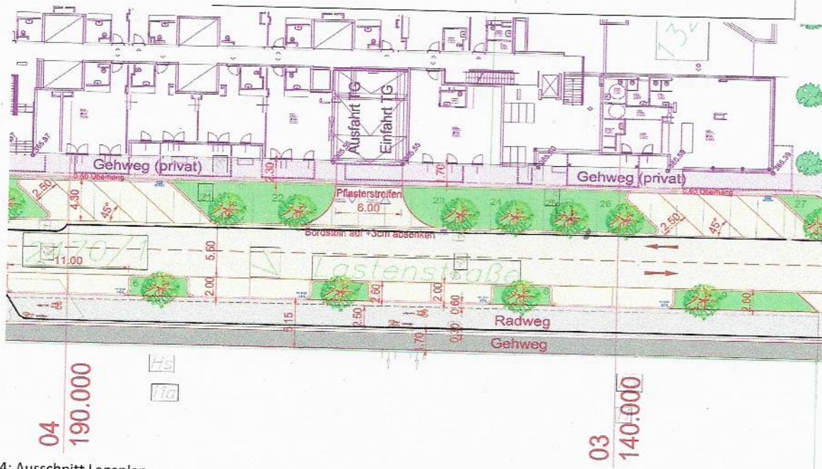
Abb. 4: Ausschnitt Lageplan

Diese Querschnittsentwicklung wurde im Vorfeld der Planung (Jänner 2020) bereits mit der Bezirksvorstehung Lend, der Wirtschaftskammer und dem dort im Rahmen des BBP tätigen Wohnbauträger GWS abgestimmt.