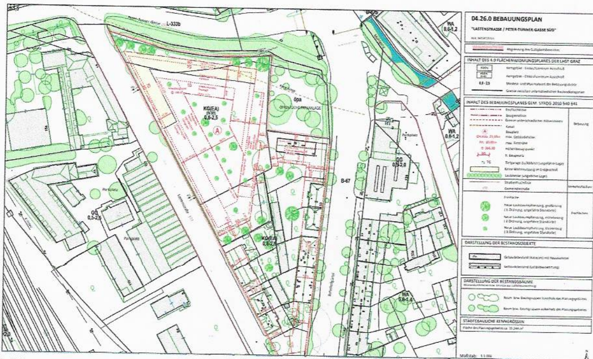
Abb. 1: Bebauungsplan 04.26.0