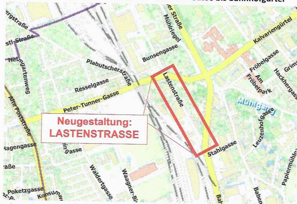
Abb. 2: Umgebungsplan

Der Straßenquerschnitt NEU, von West nach Ost, ist schematisch wie folgt aufgebaut: