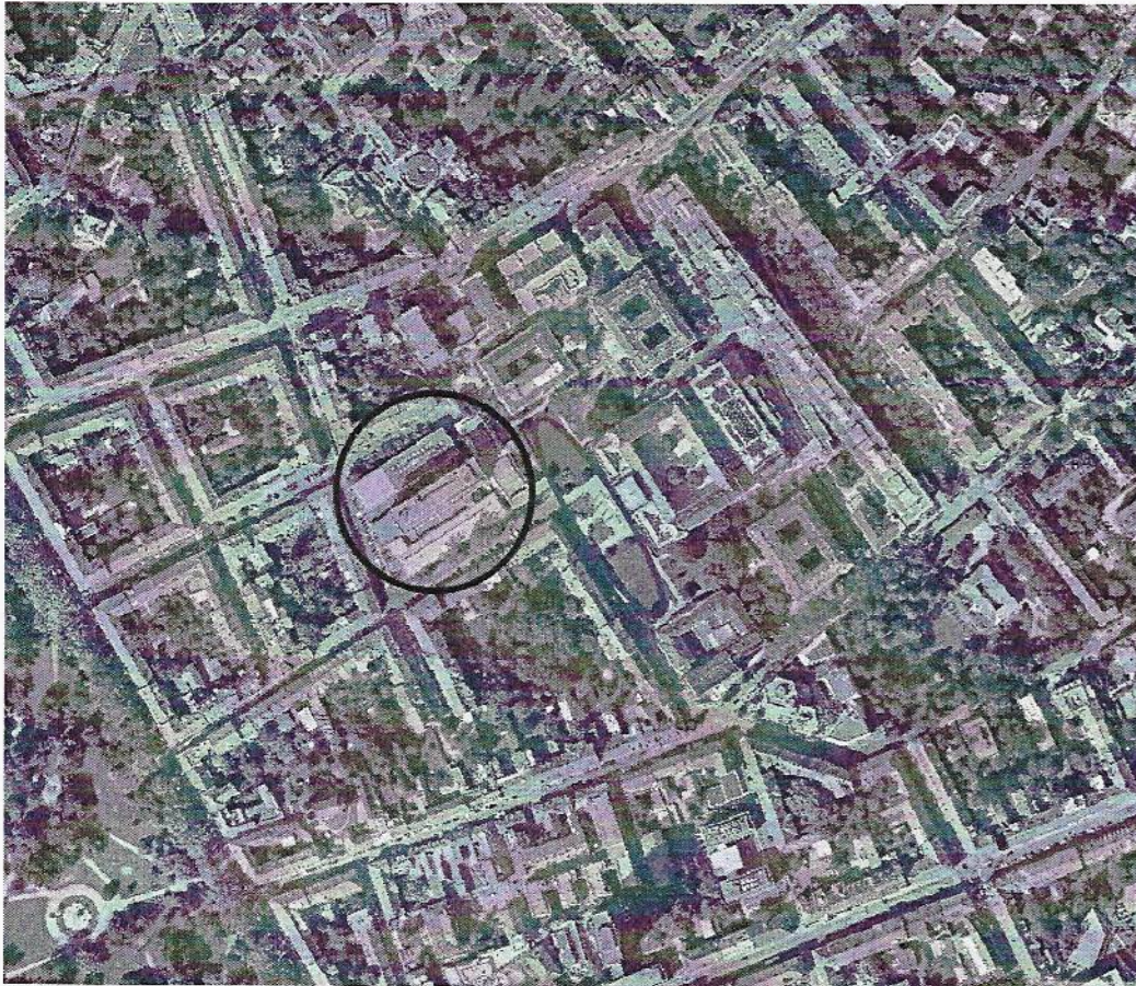
Abbildung 1: Projektgebiet mit GCP (schwarz) sowie Situierung der Tiefgarage / Anrainergarage (rot)