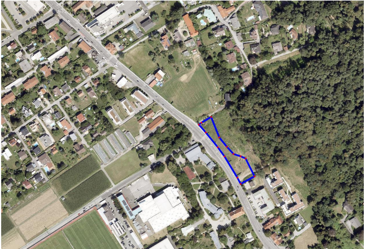
Luftbild (2021): GeoDaten-Graz Die blaue Umrandung markiert das Bebauungsplangebiet.