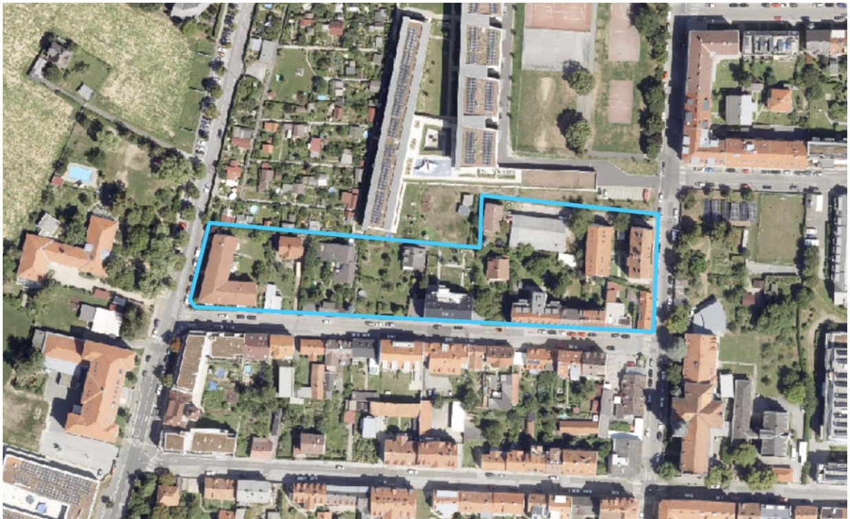
Luftbild (2022) GeoDaten-Graz: Der Rahmen kennzeichnet das Bebauungsplangebiet