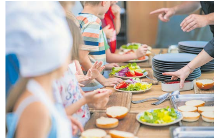
Guten Appetit! Beim Kurs „Genusskochen“ lernen Grazer Kids die Geheimnisse der Küchenprofis kennen.