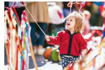
Bunt. Die Grazer Spielstraßen.