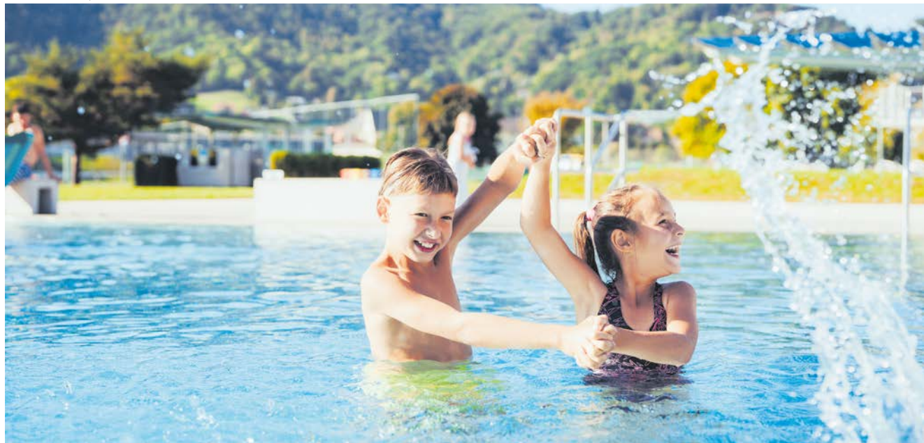
Badespaß pur. Das Auster Freibad ist bereits geöffnet, zu Christi Himmelfahrt folgen alle anderen Freibäder.