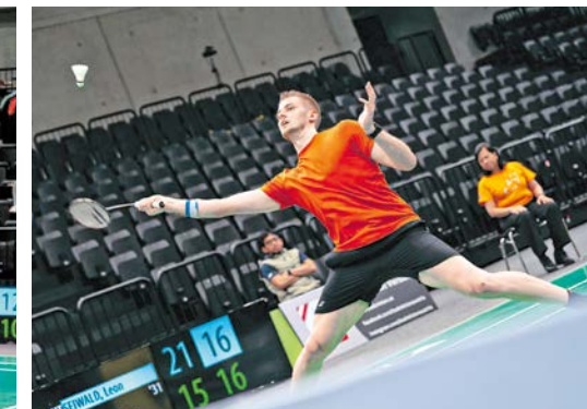
Top-Event. Die Badminton Austrian Open sind ein Highlight im Sportpark.