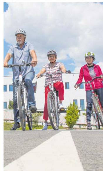
Wer rastet, der rostet: Training hält länger und sicherer mobil.

Frischer Fahrtwind für die Grazer Generation 65+: Die Stadt lädt zu einem abwechslungsreichen Mobilitätstraining ein. Die zweitägigen Kurse für jeweils 25 Personen dauern immer von 14 bis 17.30 Uhr. Die nächsten starten am 11. und 13. Mai. Weitere: am 1. und 3. Juni sowie am 29. Juni und 1. Juli. Gemeinsam mit Polizei, ÖAMTC und Partnern werden Straßenregeln aufgefrischt, Fahrradtechnik geübt und der tote Winkel erlebbar gemacht – für mehr Sicherheit und Selbstvertrauen im Alltag. Anmeldung: unter: office@familienmanagement.at sowie Tel. 0664 4106512. graz.at/seniorinnen-mobilitaet