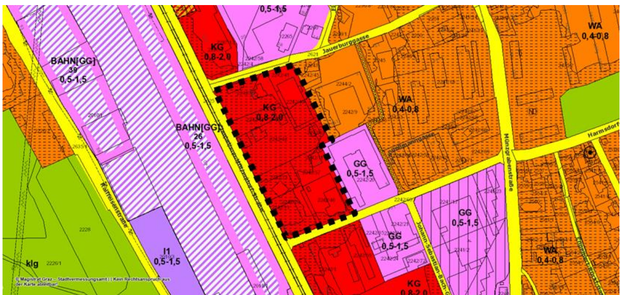
Auszug aus dem 4.0 Flächenwidmungsplan der Landeshauptstadt Graz i.d.g.F. Die schwarze Umrandung markiert das Bebauungsplangebiet.